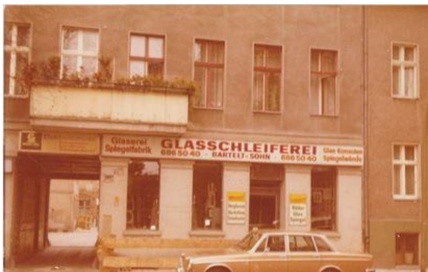
Motiv 1 Blick auf das erste Unternehmensgebäude. Schnell wurde der Standort zu klein.

Gerne senden wir Ihnen auf Wunsch druckfähige Bildmotive zu oder laden Sie ein, in unserer Produktionshalle eigene Motive zu fotografieren.